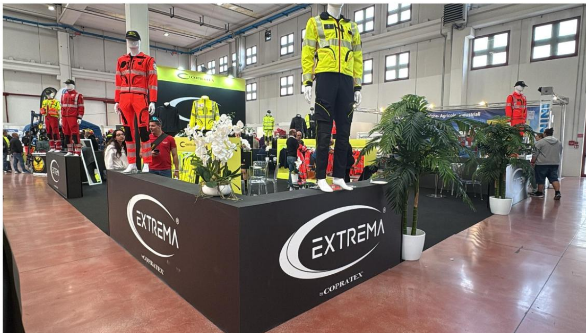
Nella foto lo stand dell'azienda pratese Copratex specializzata nella produzione di dispositivi di protezione individuale in alta visibilità per l'emergenza

Il salone è un'occasione per fare il punto sullo sviluppo e sulle prospettive di questo settore in Italia anche alla luce dei dati sui volontari impegnati in attività di emergenza e soccorso nel nostro Paese: sono oltre 4mila le organizzazioni iscritte nell'elenco nazionale del Dipartimento della Protezione Civile, di cui circa 3.850 sono associazioni locali che fanno riferimento alle strutture di coordinamento a livello regionale. In totale, si tratta di centinaia di migliaia di uomini e donne, che vengono impiegati sul campo in occasione di grandi eventi, ma anche per contribuire ad affrontare incendi, alluvioni, terremoti e altri disastri naturali. Secondo gli ultimi dati dell'Istat, nel decennio dal 2013 al 2023 i volontari organizzati nel settore dell' assistenza sociale e della protezione civile hanno visto una crescita significativa (+7,7%), tanto più se paragonata al calo del volontariato generale in forma organizzata (-3,6%).