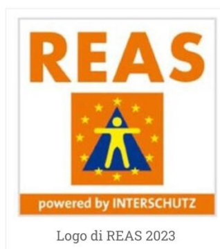
Logo di REAS 2023